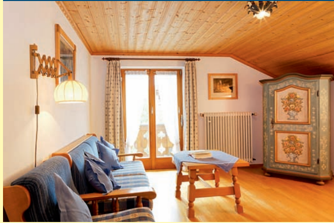
FERIENWOHNUNG NR. 2