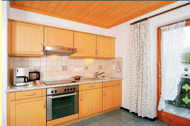
1. STOCK – SÜD- UND OSTBALKON