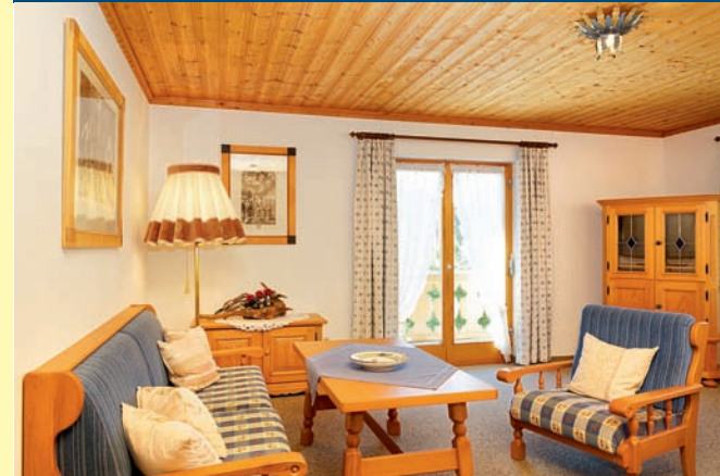
FERIENWOHNUNG NR. 4