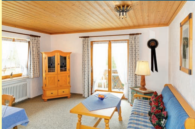
FERIENWOHNUNG NR. 3